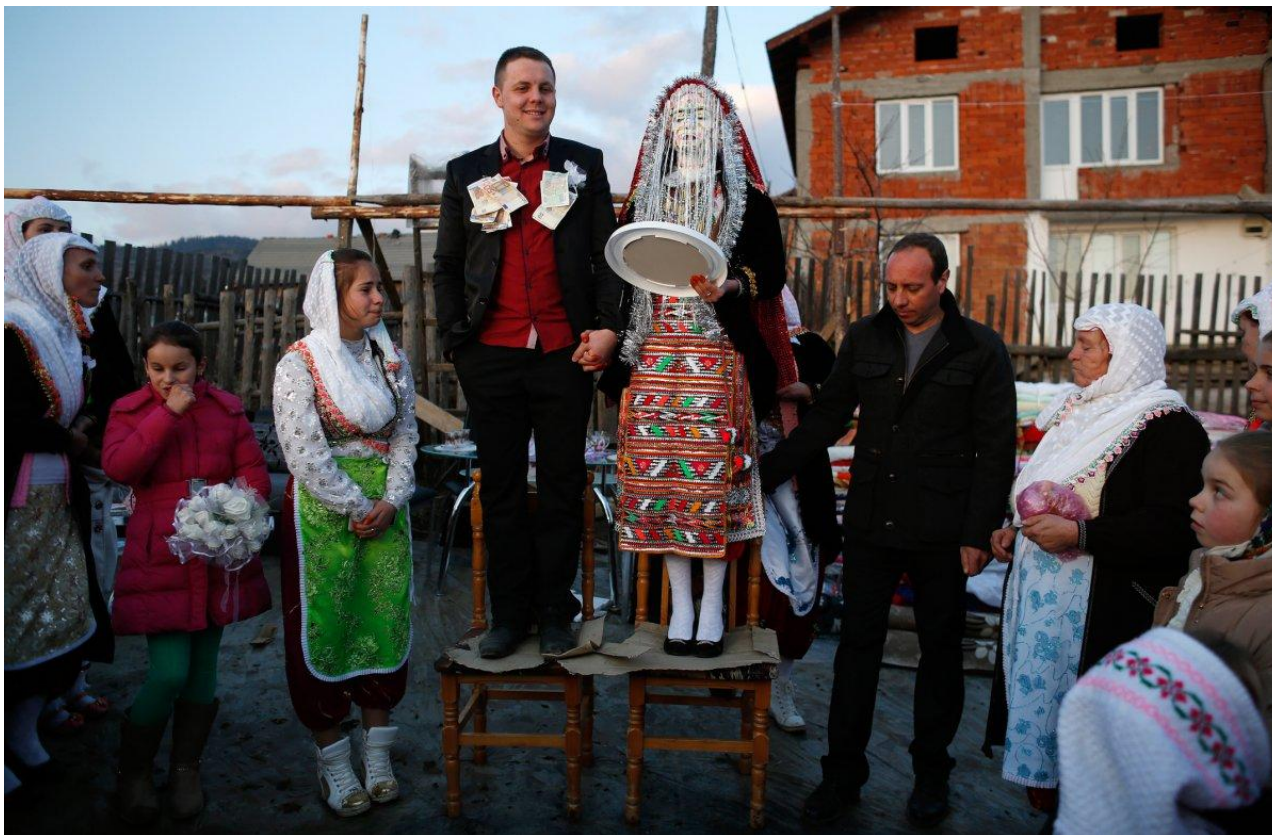
Ρίμπνοβο της Βουλγαρίας